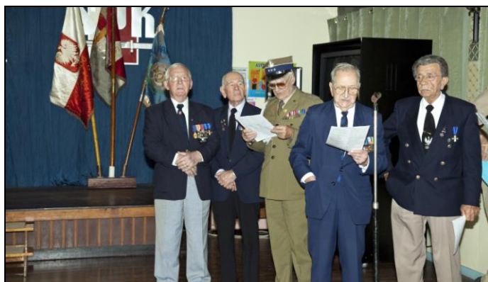
Wśród kolegów - Dzień Żołnierza - Capalaba 15/08/2010