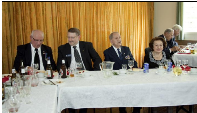
40 Zjazd SPK – Capalaba 20/10/2011