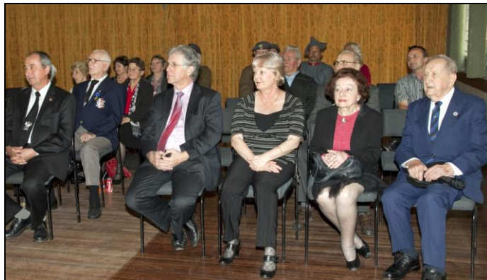
Dzień Żołnierza - Capalaba 14/08/2011