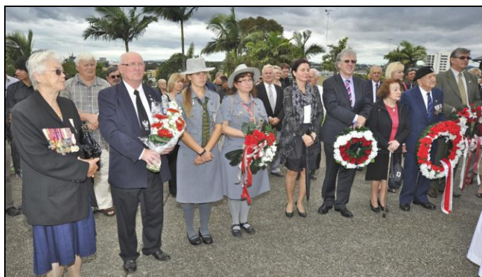
Rocznica Katynia – Bowen Hills 29/04/2012